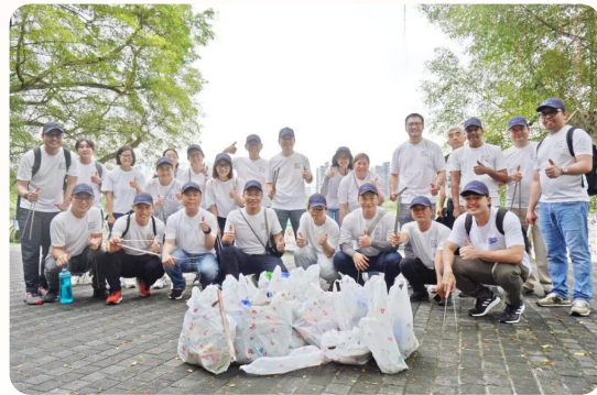
药明康德新加坡基地员工参与环境保护公益行动

2025年，德国慕尼黑基地员工参与当地“博物馆长夜”活动，推动科学走进社区；美国新泽西基地员工向数百名莫文博物馆游客讲述环境保护的意义；新加坡、美国圣地亚哥和德国慕尼黑等基地员工，参与当地社区和环境保护组织开展的生态系统和生物多样性保护行动。